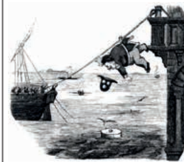
MECCANISMO INVENTATO DA FRANCESCO II DI BORBONE PER IMBARCARSI IN MOMENTO DI BISOGNO Il Lampione , 1 settembre 1860 – anonimo