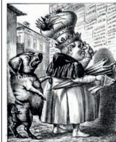
PIO IX SFRATTATO DAL QUIRINALE CERCA ALLOGGIO UMILE MA BEN FORNITO DI CIBO E VINO La Rana , 30 novembre 1866 – autore: A. Grossi