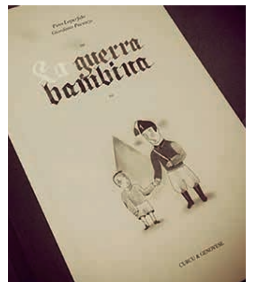
Pino Loperfido, La guerra bambina , Curcu&Genovese ed., 2014, € 14,00. Con illustrazioni di Giordano Pacenza.

A queste storie, i cui protagonisti diventano drammaticamente adulti, si accompagnano i ritratti di bambini, come inseriti in medaglioni grigio-scuro, espressivi e teneri, dai grandi occhi che hanno visto il male, delicatamente tracciati da Giordano Pacenza, illustratore sensibile e grafico abile. ■