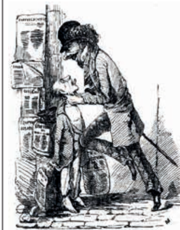
LEGGE REPRESSIVA SULLA STAMPA L'Arlecchino , 2 maggio 1848 – autore: L. Mattei